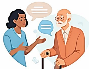
Goede communicatie en afstemming