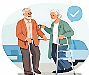
Eigen regie en